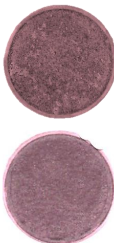
témoin non traité

→ présence de cristaux de tartre (colorés) → absence de dépôt de matière colorante